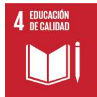
Ajuntament de Mislata