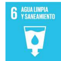
Ajuntament de Benidorm