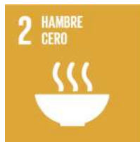
Ajuntament de València