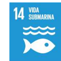
Ajuntament de Gandia