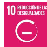
Ajuntament San Vicent del Raspeig